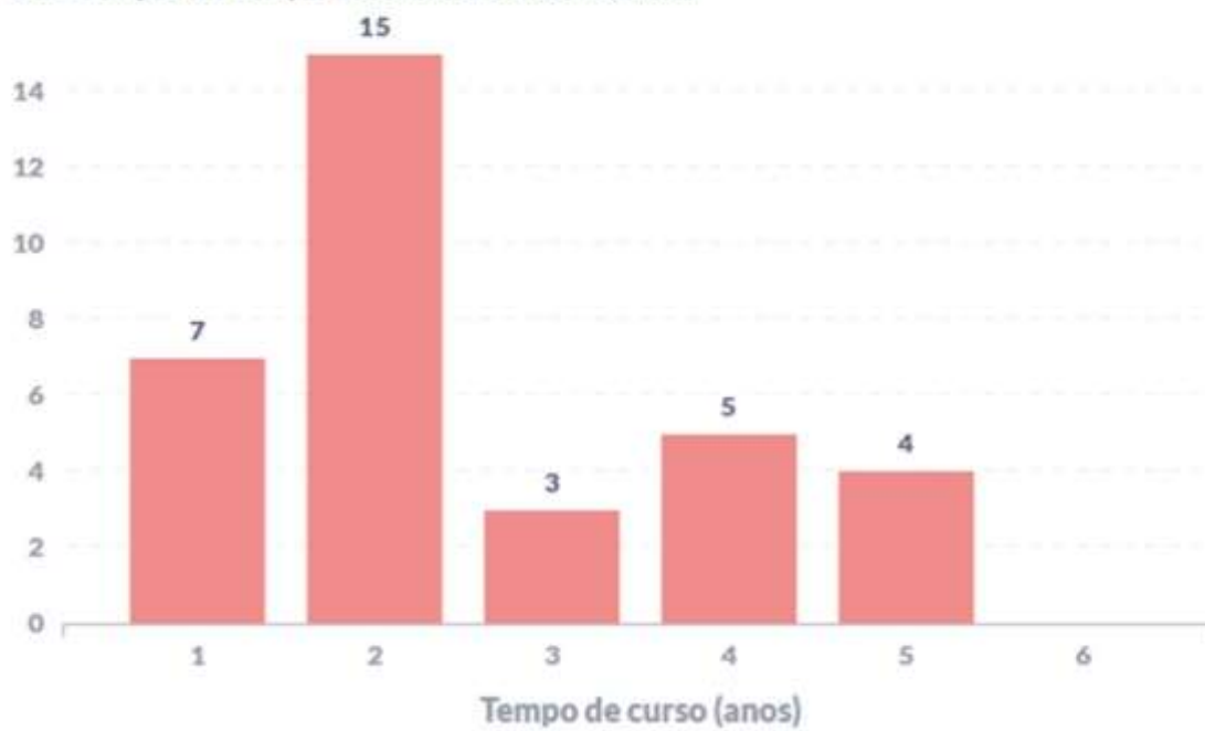
Figura 2 – Perfil temporal do momento de evasão dos estudantes do curso. Quantidade de estudantes evadidos em função no tempo de permanência no curso até evadir