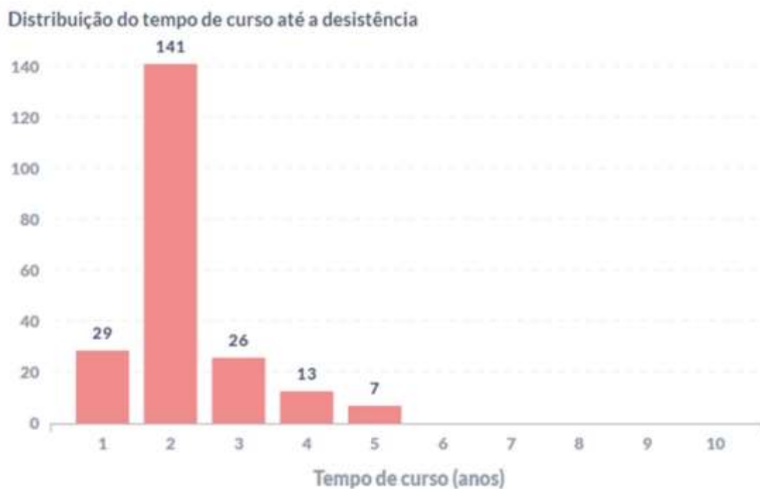
Figura 2 – Perfil temporal do momento de evasão dos estudantes do curso. Quantidade de estudantes evadidos em função no tempo de permanência no curso até evadir

O abandono do curso ocorre já no primeiro ano do curso, mas fica registrado no sistema no segundo ano. As trocas para outros cursos são as mais variadas: não apenas para alguma das Engenharias, mas Biologia, Enfermagem, Administração, Pedagogia e outros cursos. Alguns estudantes (trabalhadores?) mantêm a matrícula apesar de não conseguirem frequentar as disciplinas, terminando por abandonar mais tarde. Um percentual mínimo evade muito próximo da formatura. Alguns destes migram para a Física Bacharelado.