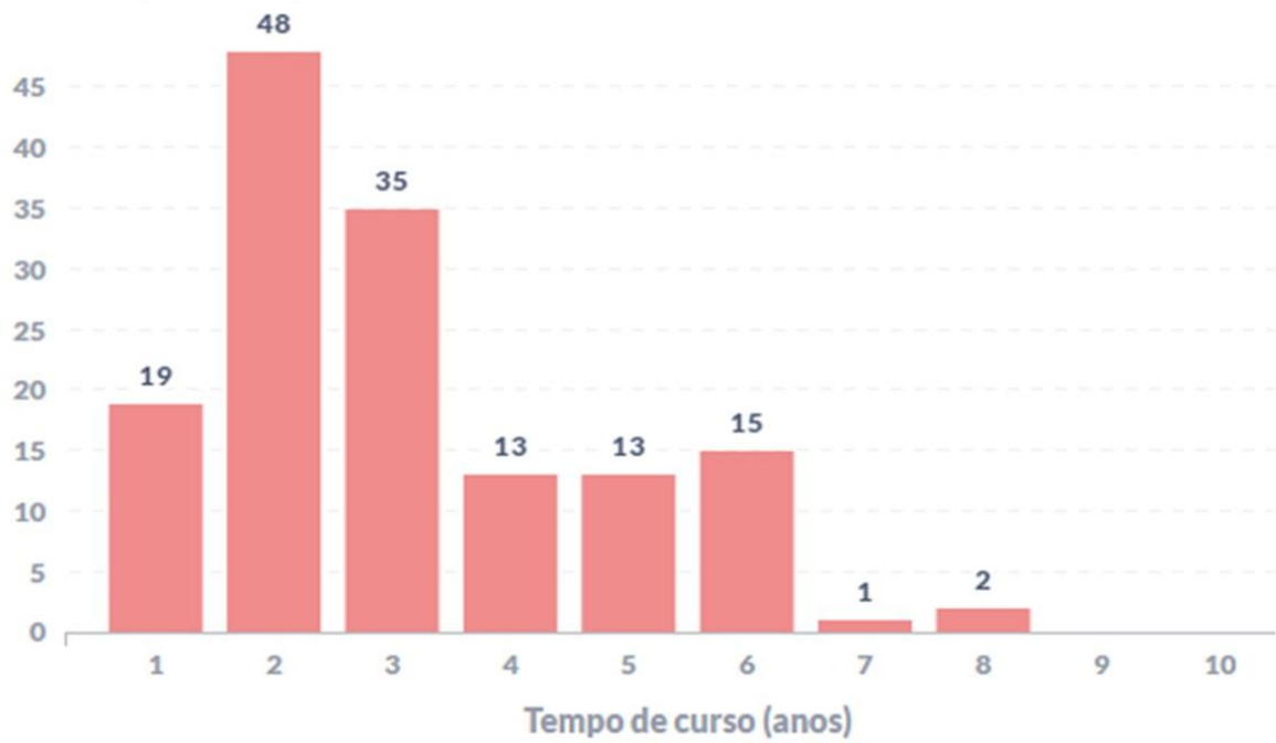
Figura 2 – Perfil temporal do momento de evasão dos estudantes do curso. Quantidade de estudantes evadidos em função no tempo de permanência no curso até evadir