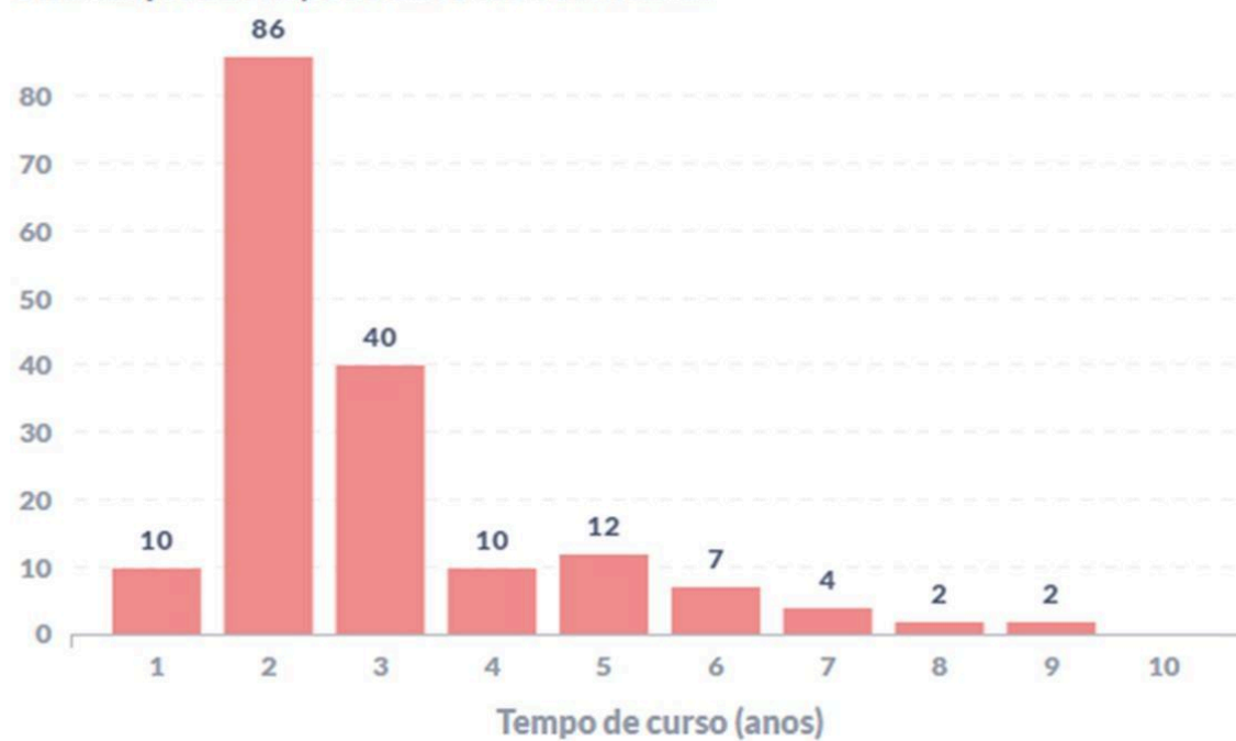
Figura 2 – Perfil temporal do momento de evasão dos estudantes do curso. Quantidade de estudantes evadidos em função do tempo de permanência no curso até evadir