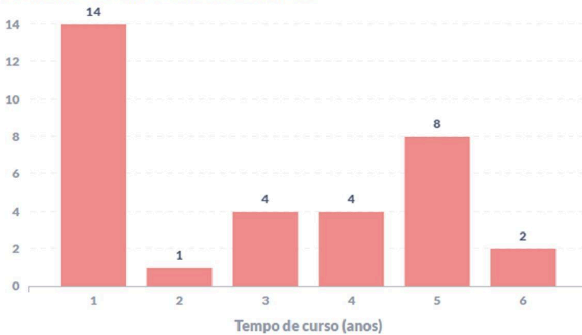
Figura 2 – Perfil temporal do momento de evasão dos estudantes do curso. Quantidade de estudantes evadidos em função no tempo de permanência no curso até evadir