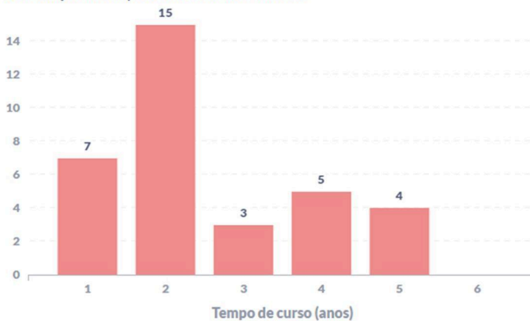
Figura 2 – Perfil temporal do momento de evasão dos estudantes do curso. Quantidade de estudantes evadidos em função no tempo de permanência no curso até evadir